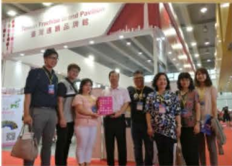
广东省连锁经营协会副会长跟台湾连锁加盟促进会台湾贸易中心中国生产第一中心领导合影