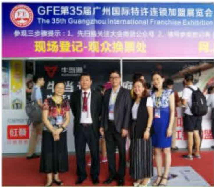
广东省连锁经营协会会长出席大会