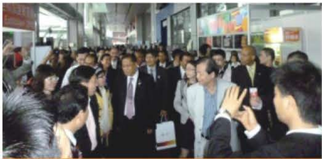
马来西亚商务部部长亲自率团参加视察广州富众加盟展，广州特许连锁加盟展览会荣获马来西亚商务部颁发的卓越服务大奖。